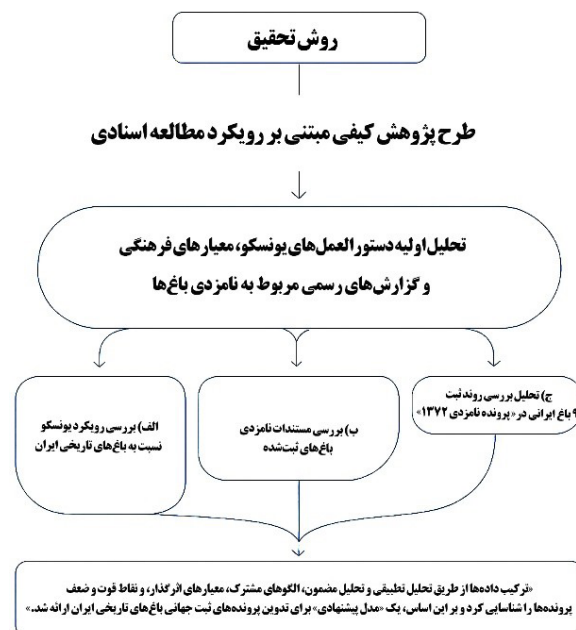
تصویر ۲. نمودار روش‌شناسی پژوهش.

ارزش‌های فرهنگی؛ ب) بررسی مستندات تاریخی باغ‌های ثبت‌شده، شامل متون پژوهشی، اسناد و نقشه‌های تاریخی برای بازخوانی تحول باغ و عناصر کالبدی-اقلیمی آن؛ ج) تحلیل گزارش‌ها و مصوبات مربوط به ارزیابی معیارهای فرهنگی میراث جهانی و روند ثبت ۹ باغ ایرانی در پرونده ۱۳۷۲ (تصویر ۲). داده‌های به‌دست‌آمده با روش تحلیل تطبیقی و تحلیل مضمون طبقه‌بندی شدند تا الگوهای مشترک، معیارهای اثرگذار و نقاط قوت و ضعف پرونده‌ها شناسایی شود. این فرایند در نهایت به تدوین «مدل پیشنهادی» برای تهیه پرونده‌های ثبت جهانی باغ‌های تاریخی ایران منتهی گردید.