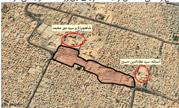
تصویر ۴. محدوده تخریب‌شده بافت تاریخی شیراز بین شاهچراغ و سید میرمحمد و آستانه سید علاءالدین حسین. ماخذ: Google Earth با ترسیماتی از نگارندگان.

فعالیت می‌کردند، ناگزیر به سازگاری با شرایط جدید و بهره‌گیری از فناوری‌های نوین برای بقای خود در بازار هستند. این تحول می‌تواند به رشد اقتصادی محله کمک کند، اما در عین حال ممکن است منجر به از بین رفتن مشاغل سنتی و هویت فرهنگی منطقه شود. اما فراتر از آن ورود فرهنگ‌های خارجی و تأثیرات جهانی باعث شده‌اند که برخی از آداب و رسوم سنتی کمرنگ‌تر شوند. جوانان بیشتر به سمت سرگرمی‌ها و فعالیت‌های مدرن گرایش پیدا کرده‌اند که این موضوع می‌تواند به کاهش مشارکت در مراسم مذهبی و فرهنگی سنتی منجر شود. اما در عین حال، این تغییرات فرصتی برای بازسازی هویت فرهنگی محله فراهم می‌آورد، زیرا ساکنان می‌توانند با ترکیب عناصر سنتی و مدرن، فرهنگ جدیدی خلق کنند. با وجود چالش‌هایی که مدرنیزاسیون برای محله بالاگفت ایجاد کرده است، فرصت‌هایی نیز برای توسعه و پیشرفت وجود دارد. به‌عنوان نمونه، افزایش امکانات آموزشی و بهداشتی، دسترسی به اطلاعات و خدمات مدرن، و ارتقاء سطح زندگی ساکنان از جمله مزایای این روند محسوب می‌شوند.