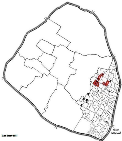
تصویر ۲. محله قوام در بالاکت، محل سکونت و عمده بناهای خاندان قوام.