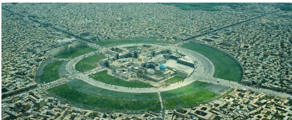
تصویر ۳. فلکه حضرتی و رینگ سبز.