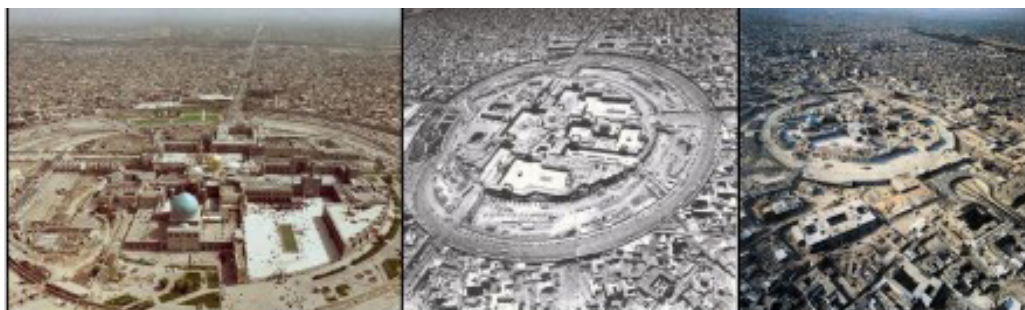
تصویر ۴. روند توسعه مجموعه حرم مطهر و احداث زیرگذر در پیرامون آن.

بالاخیابان و پایین خیابان (طاش، مهندسین مشاور طرح اندیشان شهر، ۱۳۷۴، ۵۶) به عنوان محور اصیل، میراثی و تاریخی مشهد بدون در نظر گرفتن اصول حفاظتی در دستور کار قرار گرفت. همچنین احداث رینگ شارستان با عرض ۵۰ متر در قلب بافت فشرده و کوچک مقیاس اطراف حرم به منظور صدور پروانه برای ساختمان‌های تجاری و اقامتی بلندمرتبه در اطراف آن از دیگر اقدامات این طرح در راستای ترسیم معابر جدید در بافت بود. احداث شارستان با بریدن دو محور بالاخیابان و پایین خیابان برای چندمین بار کلیت این آن را مورد تعرض قرار داد و در آخر موجب برهم خوردن شاکله، ساختار و نظامات حاکم بر بافت شد.