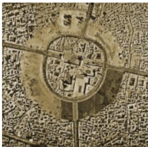
تصویر ۲. پاکسازی بافت اطراف حرم مطهر در سال ۱۳۵۴ بر اساس طرح بوروبور.